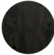
Zwart gezandstraald eiken